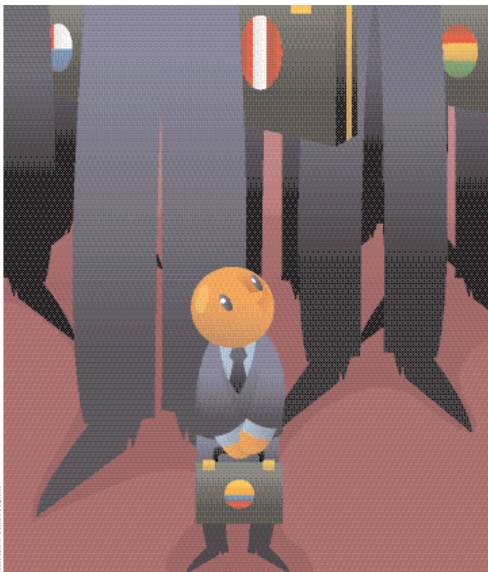
Ilustración: Camilo Pazmiño.

El Ecuador sigue en lugares muy bajos en los distintos rankings internacionales especializados, lo que refleja un estancamiento en los niveles de productividad y un escaso avance en el entorno de negocios y comercio exterior. Hay una ligera mejora —aunque todavía insuficiente— en el control de la corrupción. Este rezago preocupa por el hecho de que, a diferencia del Ecuador, sus vecinos Perú y Colombia están escalando posiciones rápidamente. Los indicadores económicos y sociales que presenta el Gobierno no pueden interpretarse en toda su magnitud, si no existe un parámetro de comparación efectivo con otras economías del mismo nivel de desarrollo. Averigüe aquí cómo ve la comunidad internacional al país.