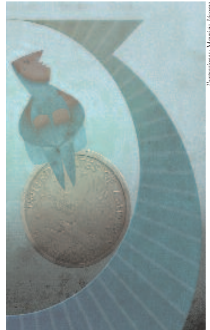
Ilustraciones: Mauricio Jácome

Una vez que exista este presupuesto, entonces se deciden las metas personales. “Las metas financieras de una persona deben hacerse en función de su