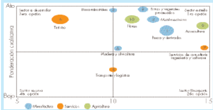
GRÁFICO 1 DIEZ APUESTAS PRODUCTIVAS