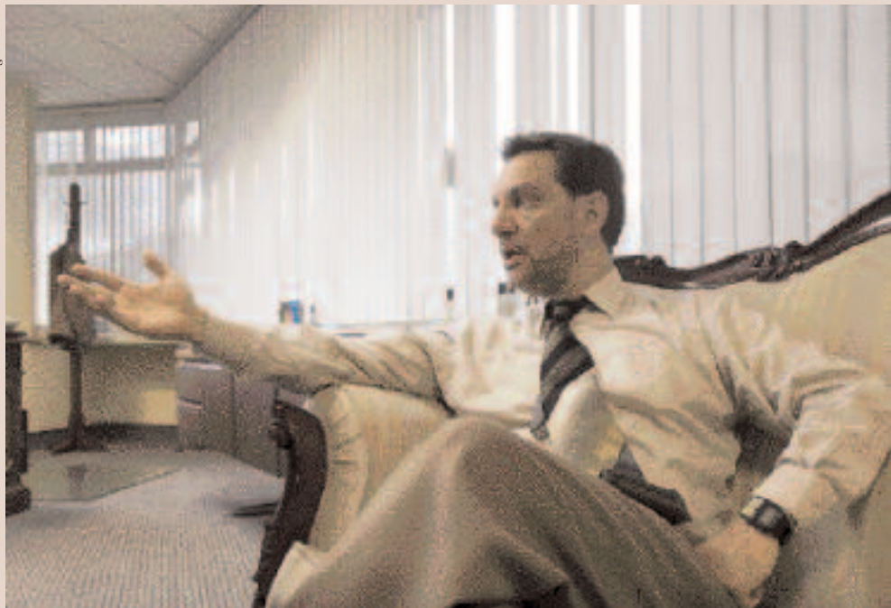
PEDRO PÁEZ, PhD en Economía, ministro de Coordinación de la Política Económica