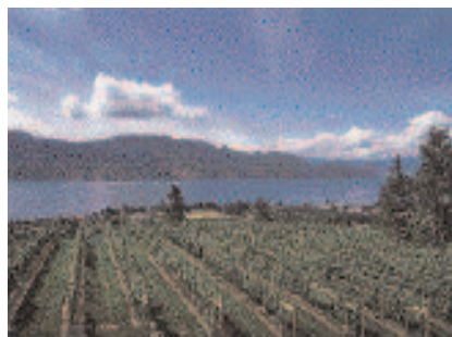
Valle del Okanagan, Canadá.

tigiosa editorial turística, que lleva 50 años en el negocio, pone a Quito en un lugar inclusive mejor que el diario neoyorquino, pero peor que MSNBC: novena entre 13 destinos.