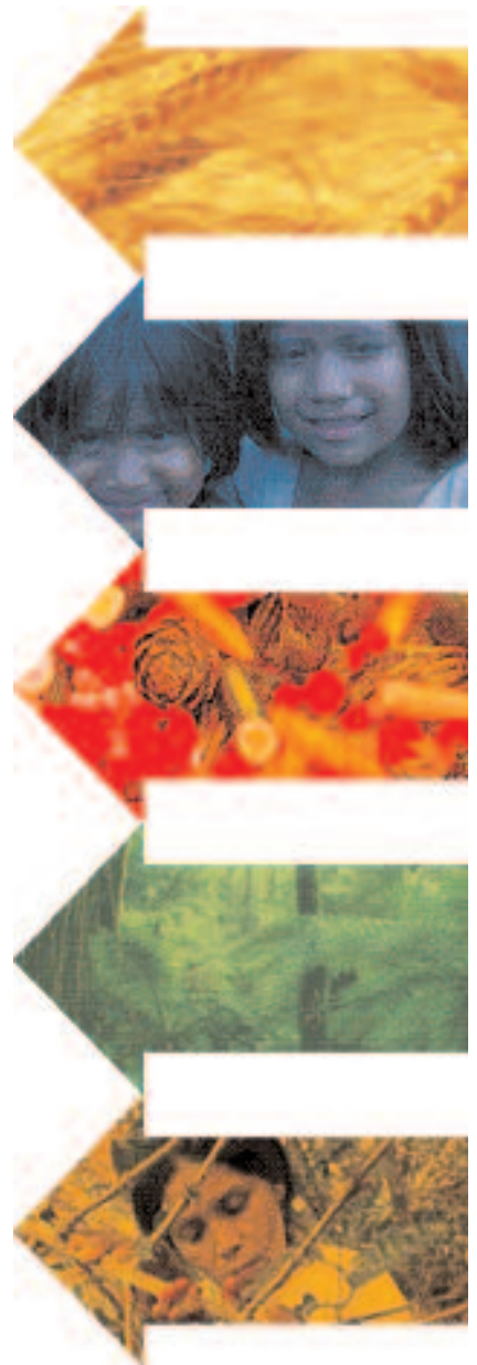
Ilustración: E. Rivas.

Nadie discute que el Ecuador debe ser un país más justo y desarrollado. El debate está en la manera y los medios para alcanzarlo. El gobierno ha insistido en el cambio del modelo económico vigente hacia uno que llama “solidario”. Aunque aún se desconoce lo que es realmente el socialismo del siglo XXI, ya se tienen las pistas de lo que en términos prácticos supone un sistema económico “solidario y sostenible”, pues la Secretaría Nacional de Planificación (Senplades) ha definido en el Plan Nacional de Desarrollo las políticas y estrategias que permitirían establecer dicho sistema. La Asamblea Constituyente será un medio para impulsarlas. Este artículo es el primero de dos en que se analiza el nuevo documento.