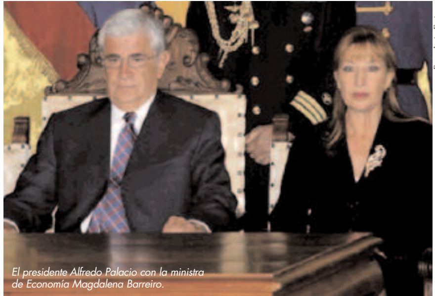
El presidente Alfredo Palacio con la ministra de Economía Magdalena Barreiro.

La interrupción de la producción petrolera en la Amazonía alertó a las calificadoras internacionales de riesgo. Por ello, el 22 de agosto, Fitch Ratings anunció que la calificación de B- para la deuda soberana de largo plazo podría ser revisada si la suspensión de producción petrolera no se resolvía pronto. Esto debido a la importancia de los ingresos fiscales, que podrían afectarse impactando negativamente la precaria liquidez pública y externa. Este anuncio hace pensar que en los meses futuros podría haber una baja en la calificación, más aún cuando