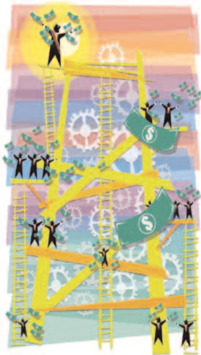
Ilustración: Wilo Ayllón.

La oferta de incremento del rancho a 60.000 efectivos de las Fuerzas Armadas y a 36.000 efectivos de la Policía en $ 20, significará