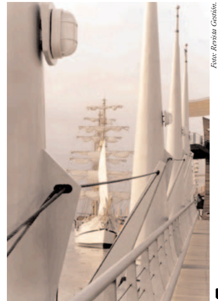
Detalle del Malecón en Guayaquil.

La respuesta inmediata del Presidente de la República, Lucio Gutiérrez, se expresó en forma espontánea a través de un entusiasta aplauso. La reacción de la opinión pública en general —especialmente guayaquileña—