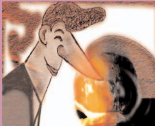
Ilustración: Lorena Zurita.

Kenny creció, y cuando fue mayor pasó a ocupar la dirección de una compañía llamada Enron... G