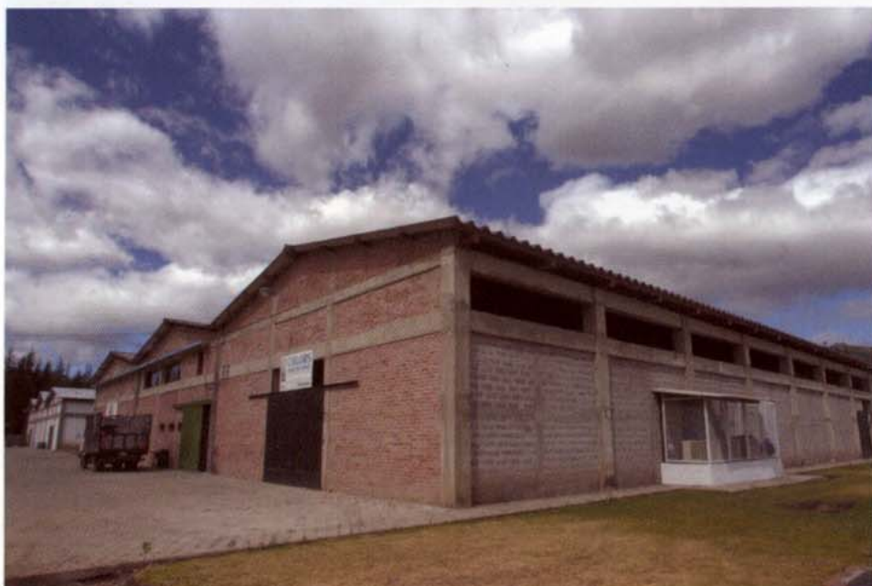
Imágenes de Metrozona, la zona franca cercana a Quito, en Yaruquí.

de que el sistema de zonas francas es eficaz y beneficioso. Otras seis empresas ya han sido calificadas como usuarias de la Metrozona y pronto estarán en plena operación y funcionamiento (Cuadro 2).