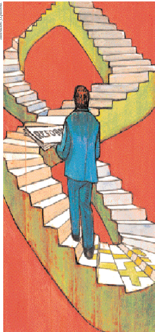
Ilustración: J. p. patirina

La reforma tributaria no fue incluida en ninguna de las leyes "trole" y así el Gobierno desperdició la apertura de los bloques legislativos. Tampoco la presentó en septiembre del 2000 y solo lo hizo siete meses después... y a medias.